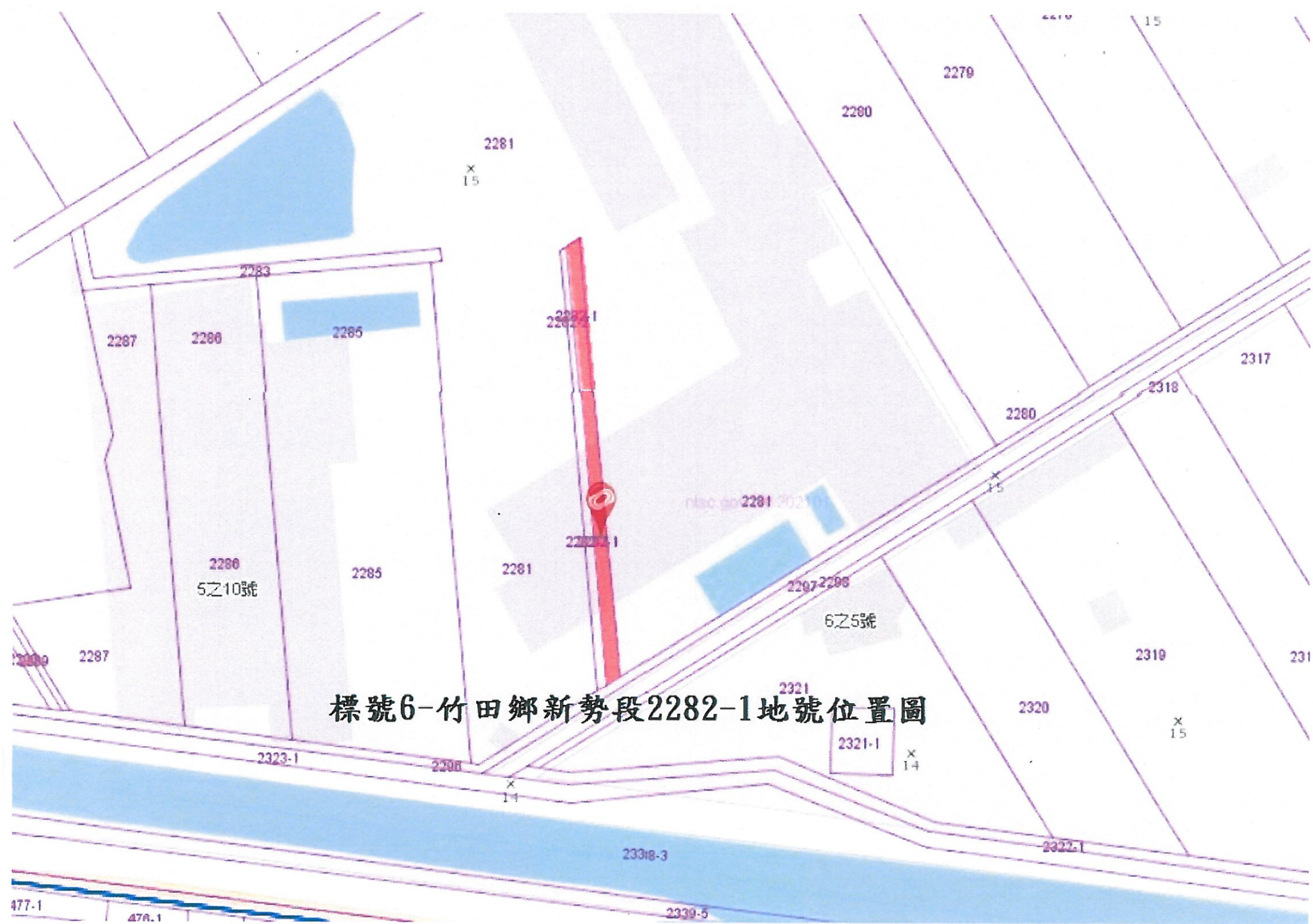
標號6-竹田鄉新勢段2282-1地號位置圖