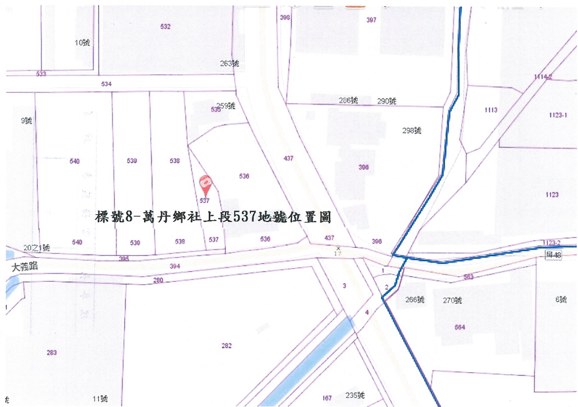
標號8-萬丹鄉社上段537地號位置圖