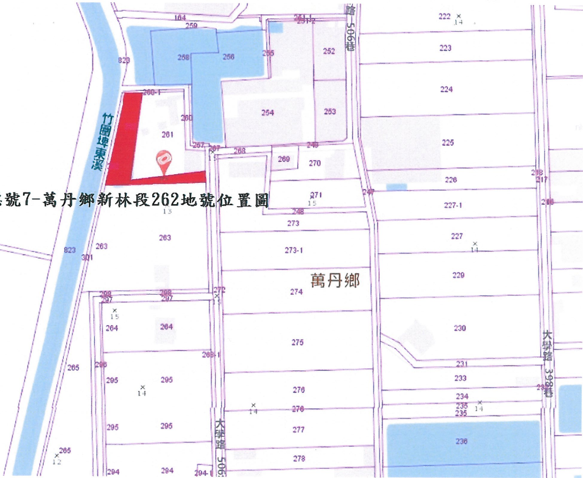
標號7-萬丹鄉新林段262地號位置圖