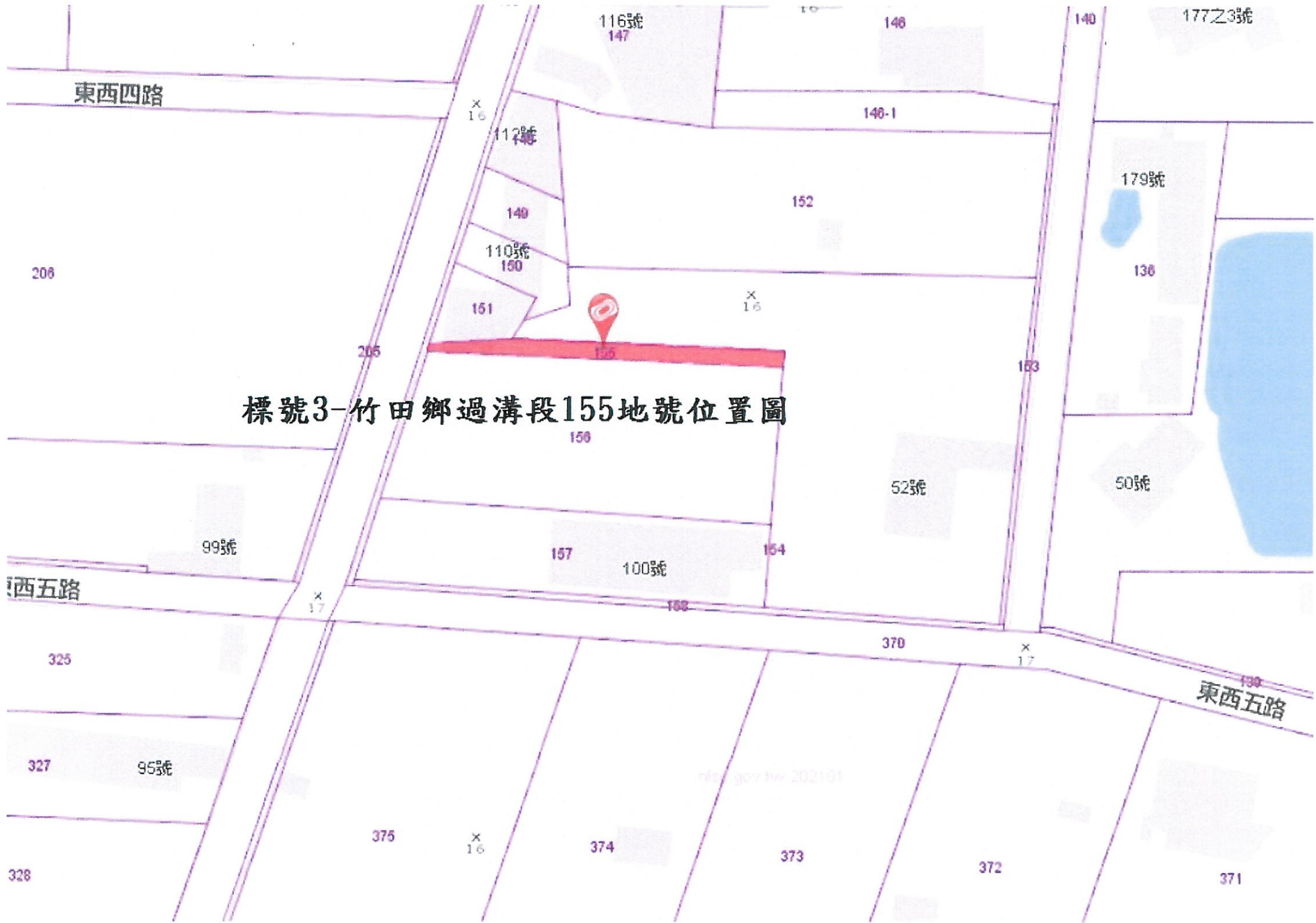
標號3-竹田鄉過溝段155地號位置圖